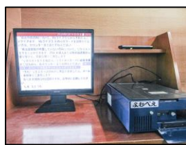
音声拡大読書器「よむべえ」