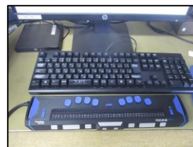
点字ディスプレイ