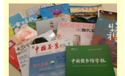
湖南省から届く雑誌は 2 階の雑誌コーナーにあります。

図書館職員の交流も行われ、2007 年には湖南図書館から研修職員 2 名をお迎えしました。3 か月間、ともに仕事に取り組むなかで、私たちもおおいに刺激を受けました。資料交換事業は、現在もかたちを変えて継続されています。県民活動が架け橋となった「湖南省友好文庫」を通して、「だれもが利用できる」という公共図書館の原点をあらためて見つめなおしたい 40 周年です。どうぞお気軽にお立ち寄りください。