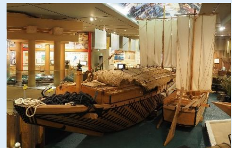
琵琶湖博物館に展示される丸子船

同じころ出現したのが、その後の江戸時代を中心に活躍した「丸子船」です。水深の浅い琵琶湖に合わせて、船底の断面はゆるやかに丸みを帯び、喫水(水面下に沈む部分)が抑えられているほか、淡水ゆえに浮力が小さいことを補うため、両側面には「オモギ」と呼ばれる太い木を取り付けるなど、琵琶湖で使うための独自の工夫がされています。板を斜めに張り合わせて船首を形づくる「ヘイタ」も、丸子船をはじめとする琵琶湖の船の特徴のひとつです。