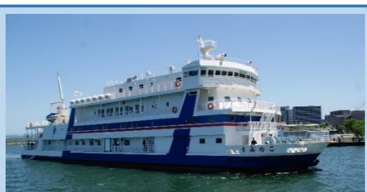
平成 30 年（2018 年）に就航した「二代目」うみのこ