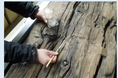
塩津港遺跡から出土した船板

近年、長浜市・塩津で平安時代のものとみられる船板が発見されました。この頃はまだ丸木船の時代と考えられており、板を組み合わせて船体を作った「構造船」として、最古級の遺物である可能性があります。