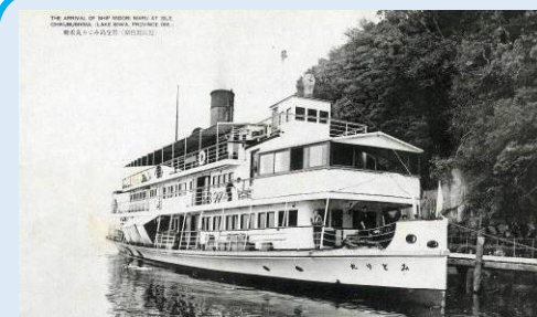
竹生島に着岸する「みどり丸」

【参考文献】『湖の城・舟・湊』太田浩司著 サンライズ出版 2018 年 S-2180-18、『琵琶湖の船が結ぶ絆』滋賀県立安土城考古博物館 2012 年 S-6880-12、『琵琶湖の船 丸木舟から蒸気船へ』大津市歴史博物館 1993 年 S-6880-93、『航跡 琵琶湖汽船 100 年史』琵琶湖汽船株式会社 1987 年 S-6800-87、『おうみ文化財通信 vol.27, vol.29, vol.35』滋賀県文化財保護協会 2016 年・2018 年