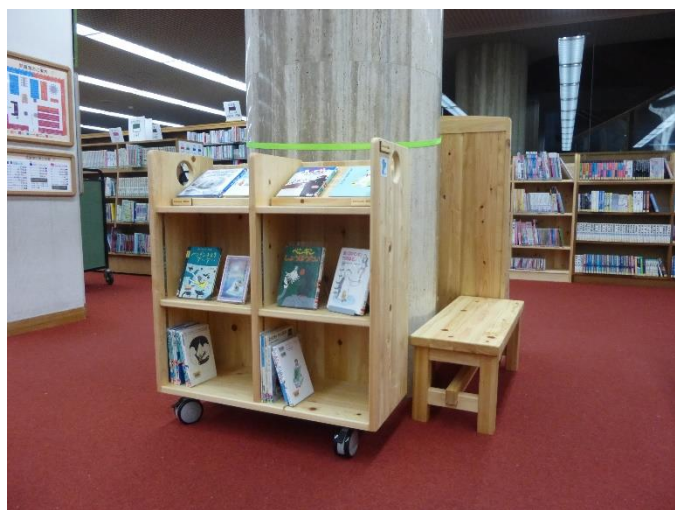
(写真：展示用ブックトラックとベンチ)

2月13日には、農林中央金庫大阪支店様より県産材を使った木製品をご恵贈いただきました。児童室の入口近くにはパンフレット台と書架、カウンター前にはベンチを置いています。また、各展示コーナーにはブックトラックと書架が入り、より充実した展示コーナーになりました。ちしきの本と読み物の書架の上には表紙見せの棚を追加しました。木のぬくもりが感じられ、より明るい雰囲気になった児童室をぜひご利用ください。